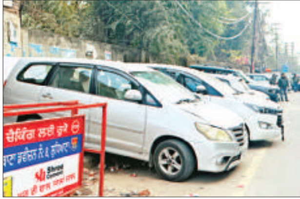
फिरोजगांधी मार्केट में फुटपाथ पर लगे वाहन

लुधियाना/यूटर्न/30 दिसंबर। लुधियाना की फिरोजगांधी मार्केट समेत कई पार्किंग साइटों का जल्द टेंडर लगाने की संभावनाएं हैं। वैसे तो मेयर प्रिंसिपल इंद्रजीत कौर द्वारा 21 दिसंबर को दावा किया था कि आने वाले एक हफ्ते तक टेंडर लग जाएगा। लेकिन अभी तक टेंडर की प्रक्रिया शुरू होने की कोई बात सामने नहीं आई है। जिसके चलते अभी असमंजस की स्थिति बनी हुई है। वहीं चर्चा है कि हर बार कुछ भ्रष्ट अफसरों द्वारा आपसी मिलीभगत करके पार्किंग ठेके अपने चहेते ठेकेदारों को ही दिलाए जाते हैं। जिसके चलते उनकी और से जानबूझकर टेंडर की शर्तें ही इस मुताबिक रखी जाती हैं, कि उन शर्तों को 1-2 ठेकेदार ही पूरा कर पाते हैं। जिसके चलते घुमकर वह ठेका भ्रष्ट अफसरों के साथ सेटिंग करने वाले ठेकेदारों को मिल जाता है। इस बार भी चर्चा है कि मेयर के इस ऐलान के बाद ठेकेदार और भ्रष्ट अधिकारी आपसी सांडगांट में जुट गए हैं। उनकी तरफ से सेटिंग की जा रही है कि आखिर किस तरीके से ठेके चुनिंदा ठेकेदारों को ही दिलाए जा सके। वहीं अब देखना होगा कि क्या नगर निगम कमिश्नर आदित्य डेचलवाल और मेयर प्रिंसिपल इंद्रजीत कौर इन ठेकेदारों और भ्रष्ट अफसरों की चाल को फेल कर पाते हैं या नहीं। क्योंकि इस बार सभी की नजर इन पार्किंग टेंडरों पर ही टिकी हुई है।