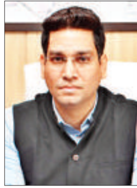
नगर निगम कमिश्नर आदित्य डेचलवाल