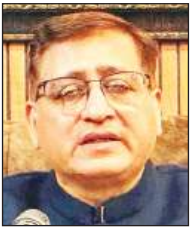
संत अश्वनी बेदी जी