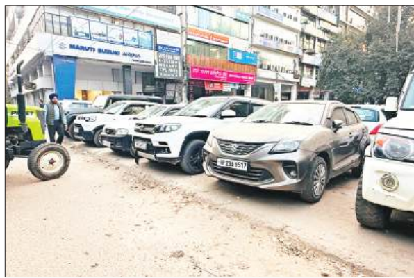
फुटपाथ पर खड़े वाहन