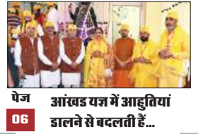
पेज 06 आखंड यज्ञ में आहुतियां डालने से बदलती हैं...